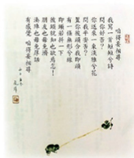
摘自陳照珠著 現代台語詩（桂花芳內兮話）