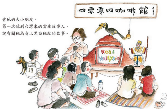
當地的大小朋友，第一次聽到台灣來的雲林故事人，說有關斑馬身上黑白斑紋的故事。

共有《雲林山海經》、《故事～厝》兩本繪本是馬來西亞藝術家——劉啟暉，為記錄這十幾年來的臺馬故事文化交流而創作，而且也有《走讀雲林》、《故事～厝》、《老港是我家》等 3 個故事箱，以及長頸鹿故事館故事旅行箱，延續臺灣和馬來西亞共創共享故事文化的深度和廣度。